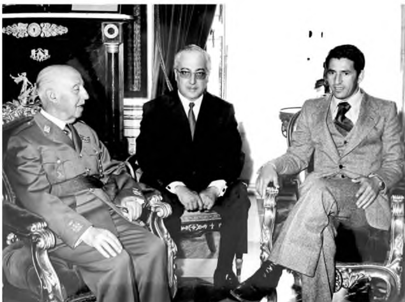
جانب من لقاء بين القائد الإسباني فرانثيسكو فرانكو وعبد السلام جلود، إسبانيا، تموز/ يوليو 1970 .